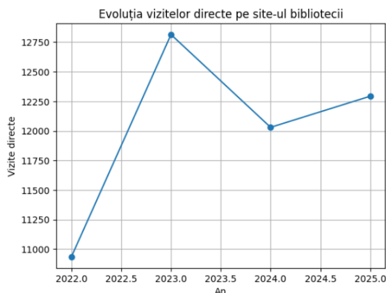
Evoluția vizitelor directe